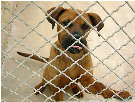
Salvando animales abandonados

A l'any 2004 es va crear la Fundació SOS Animal. A l'any 2008 es va llogar un terreny al costat de la canera i s'està elaborant un projecte d'ampliació.