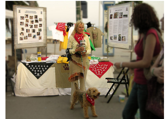
Conocer para querer

La conscienciació sobre el respecte vers els animals i la seva tinença responsable és l'objecte de fons del nostre treball. Només amb un criteri sensible alhora que coneixent millor als nostres germans els animals podem evitar el dolor que els causem inútilment. Intentem estar presents en diversos i esdeveniments i festes donant informació e intercanviant experiències amb gent de tot arreu, i recollint fons que ens permeten continuar amb la nostra tasca a Calvià i a les Illes.